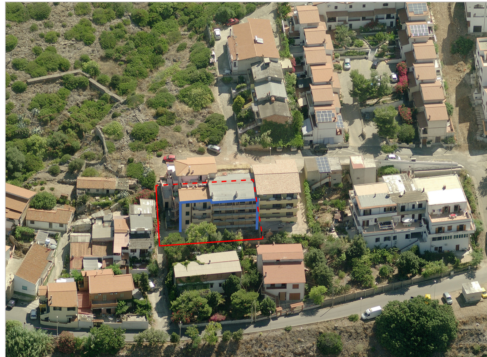
VISTA FOTO 3D ISOLATO