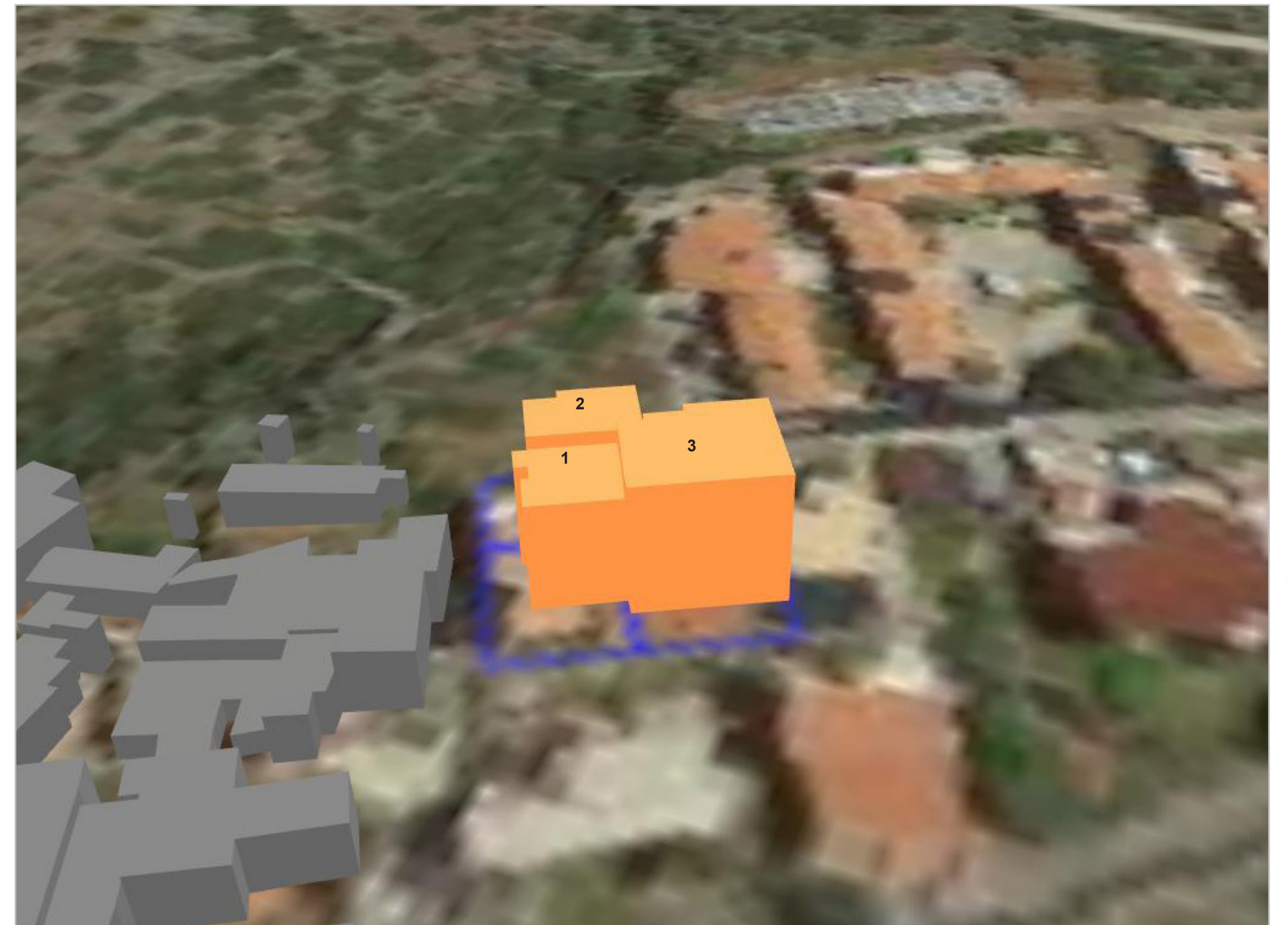
PROGETTO GRADI DI TUTELA 3D